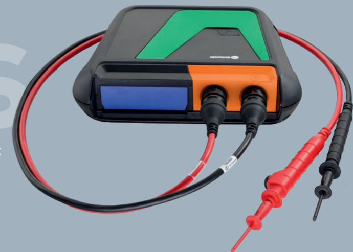
bestehend aus MT-HV + Hochvolt-Messleitungen schwarz/rot