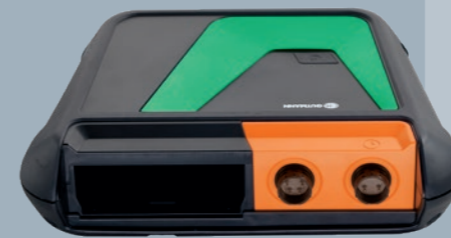
bestehend aus MT-HV